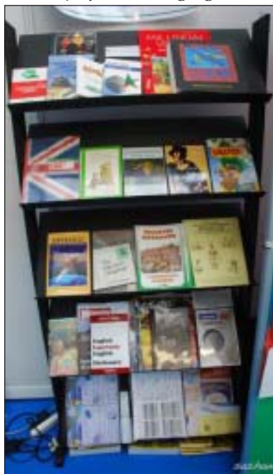
Book display at the Language Show

included in the 'taster class' programme, can't have failed to have a positive influence on a significant and opinion-forming demographic – which some might argue it is essential for Esperanto to reach.