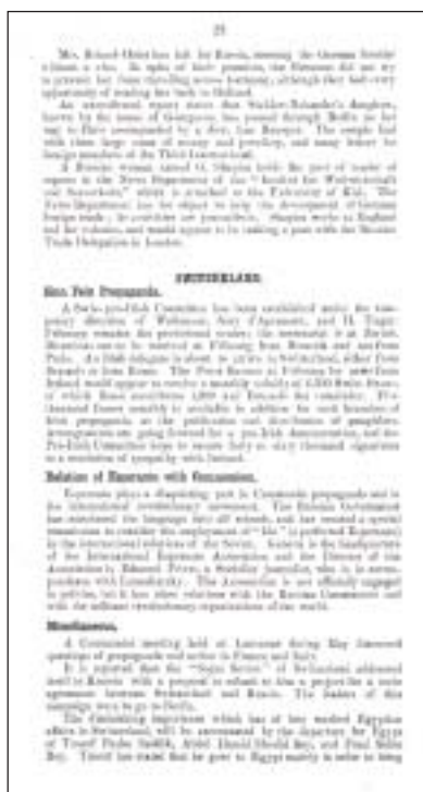
An original page of an intelligence report from 1921 on Esperanto's "disquieting part in Communist propaganda and in the international revolutionary movement".

The Monthly Review of Revolutionary Movements in British Dominions Overseas and Foreign Countries , No. 32, June 1921 (Catalogue reference CAB 24/126) is very specific about fears within agencies of the British government.