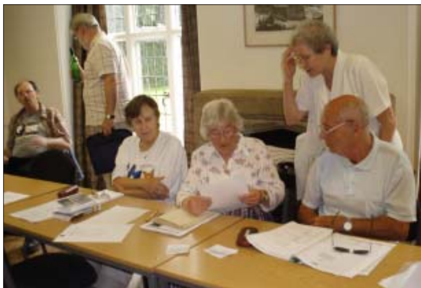
Photos of work and play from last year's 'Somera Festivalo' at Wedgwood Memorial College, Barlaston

Leaflets have been distributed with EAB Update , and booking forms will soon be available from the EAB office or online from: www.esperantoeducation.com/residential.html . □