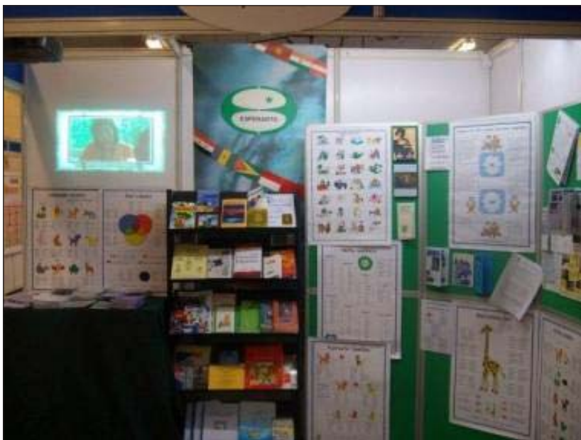
EAB's stand presenting Esperanto at this autumn's London Language Show

22–24 majo 7a Mez-Kanada Renkontiĝo de Esperanto , Tririveroj, Kebekio. Turisma amikeca semajnfino. Okazas vizitoj kaj komunaj manĝoj. Inf.: Esperanto-Societo Kebekia,