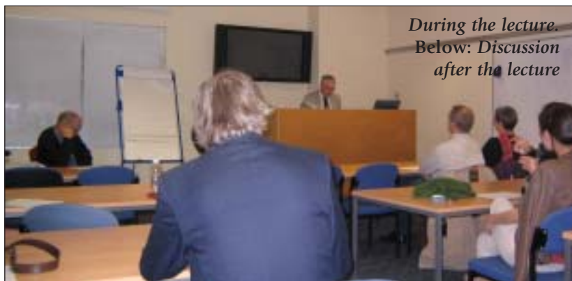
During the lecture. Below: Discussion after the lecture

An Esperanto version of the lecture will be published in due course. ▣