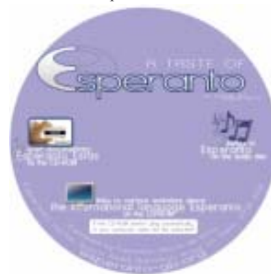
EAB's popular new CD-ROM A Taste of Esperanto

gested when you get there. But the organisers have had many requests to put the show on in Scotland. So in May 2011, it will take place Glasgow as well.