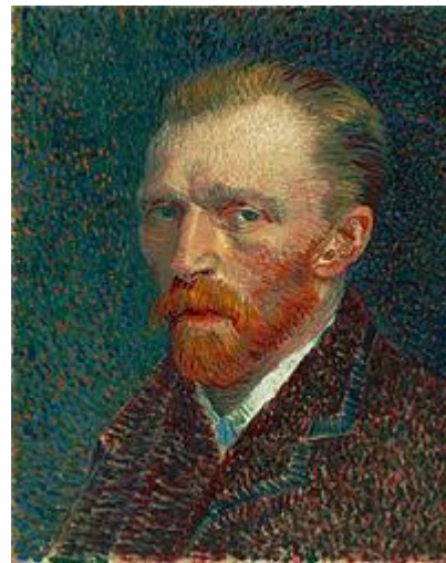
(vidu 11 novembro)

Bv. sendi informon al la bultenisto antaŭ 9a decembro por mencio en la sekva Kluba Bulteno.